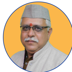
संकल्पना प्रा. क्षितिज पाटुकले